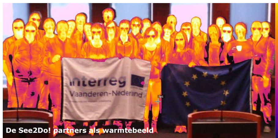
De See2Do! partners als warmtebeeld

De aanwezigen waren heel tevreden over de interactieve aanpak met de standen. Bovendien lieten de genodigden weten dat er tijdens de netwerkmomenten interessante contacten gelegd werden. Ook de twee volgende ervaringsuitwisselingen (Brugge, regio Interleuven) zullen volgens dit interactief concept verlopen.